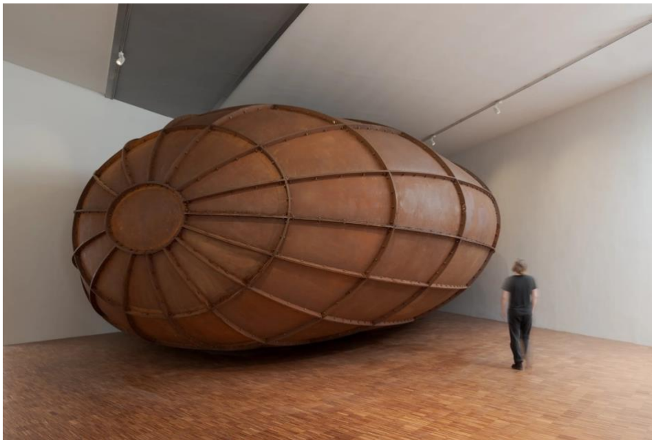
Anish Kapoor, Memory, 2008.

MN: Mange af dine værker kræver på en måde, at man oplever dem over længere tid. Hvilken rolle spiller tid for dig?