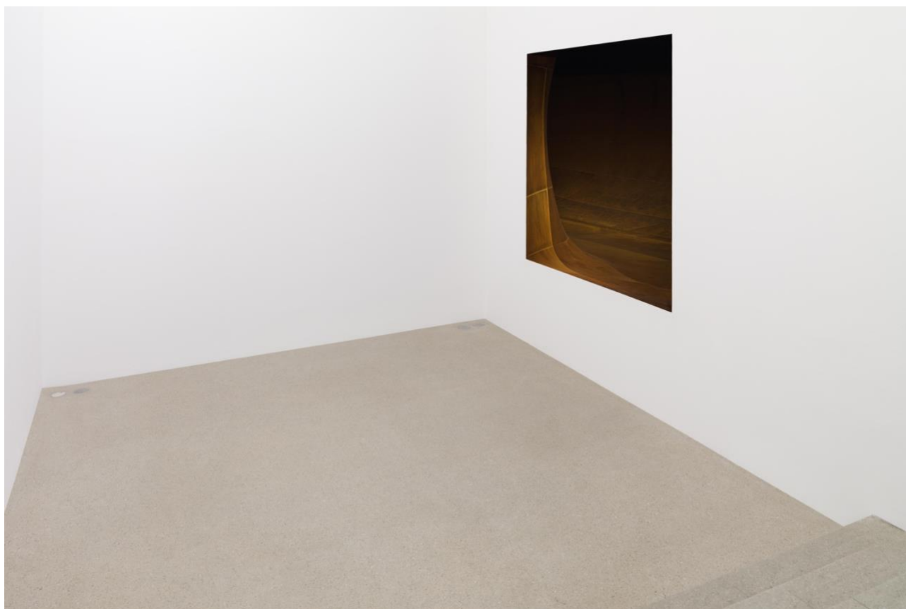
Anish Kapoor, Memory, 2008 II.

Anish Kapoor blev født i Indien af forældre med pakistansk-indisk og irakisk-jødisk baggrund. Han flyttede til London for at studere ved Hornsey College of Art i 1973 og Chelsea School of Art i 1977. I løbet af 80'erne og 90'erne blev Kapoor i stigende grad anerkendt for sine organiske skulpturer og installationer, lavet af materialer så forskellige som sten, aluminium og harpiks, der udfordrede tyngdekraften, dybden og opfattelsen af verden. I 1990 repræsenterede han Storbritannien på Venedig Biennalen med sin installation Void Field , et gitter af ru sandstensblokke, hver med et mystisk sort hul, der trængte igennem dens øverste overflade. Kapoor er siden fortsat med at udforske ideen om tomrummet i resten af årtiet og skaber serier af værker, der inkorporerer konstruktioner, som trækker sig ind i vægge, forsvinder i gulve eller dramatisk ændrer dybden i rummet med en simpel ændring i perspektiv.