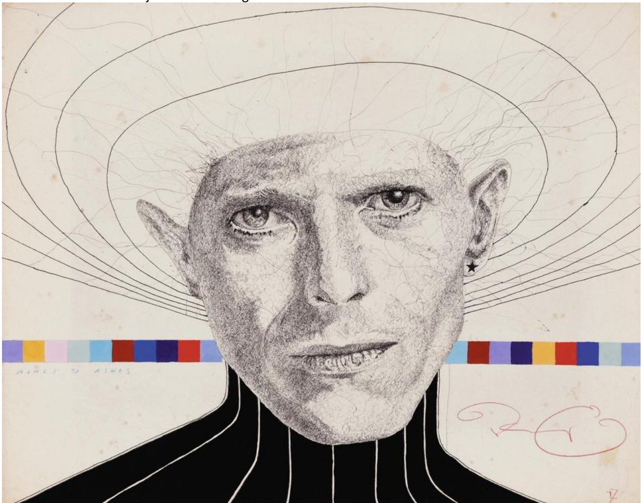
Ashes to Ashes. Portræt af David Bowie (1947-2016).

Som billedkunstner arbejder han alene og skal ikke diskutere sin kunst med andre.