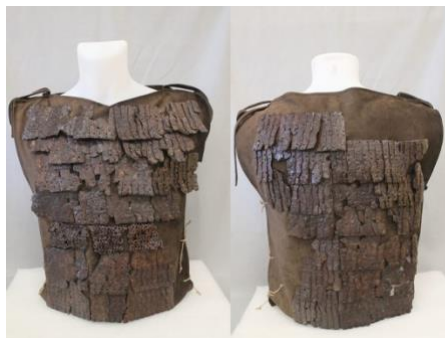
Lorica Musculata – Den